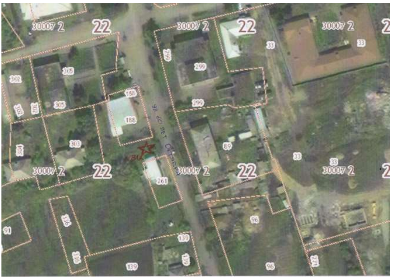
с. Нижнекаменка, ул. 60 лет Октября,81-а