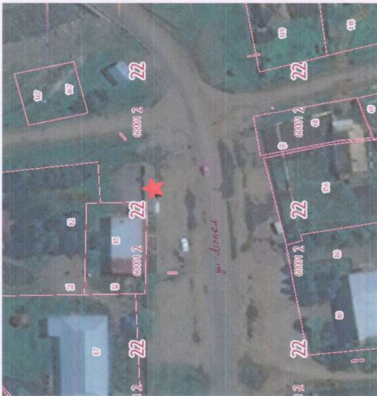
С.Алтайское, ул.Лесная, 47/1